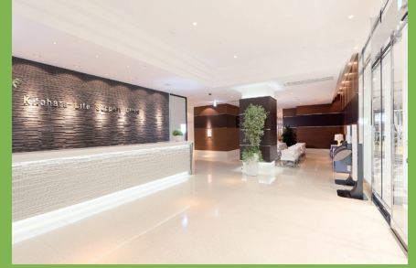
北原ライフサポートクリニック

〒192-0904 東京都八王子市子安町 4-7-1 サザンスカイトワー八王子 1F 電話番号 042-692-3332