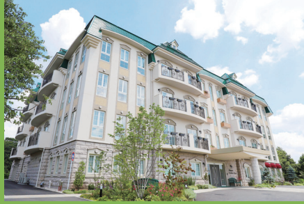
北原リハビリテーション病院

〒192-0045 東京都八王子市左入町 461 電話番号 042-692-3332