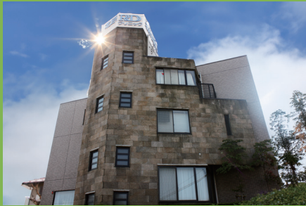
北原 RD クリニック

〒192-0045 東京都八王子市大和田町 4-1-18 電話番号 042-656-2221