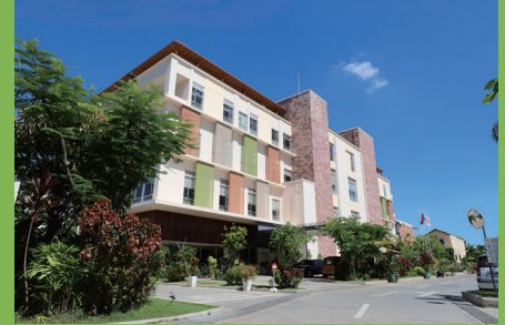
Sunrise Japan Hospital, Phnom Penh

Phum 2, Sangkat Chroy Changvar, Khan Chroy Changvar, Phnom Penh 電話番号 +855-23-432-022