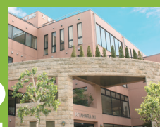
北原国際病院 東京都八王子市 大和田町1丁目7-23